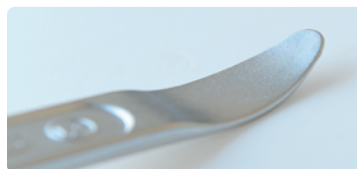
絶妙なカーブを描くベントタイプ