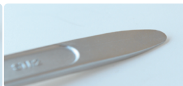
どこにでも入れやすいストレートタイプ